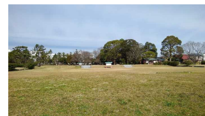
遠江国分寺跡史跡

教育長答弁 主な整備内容と して塔、金堂などの主要な建 物の基礎整備や灯籠の復元、 園路やトイレ、あずまやの設 置などが挙げられる。今後の スケジュールについては、令 和3年度から本格的な工事を 開始し、令和7年度までに事 業を完了する予定である。